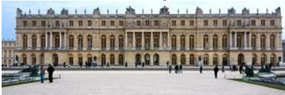
Façade du château de Versailles

Ce palais devient un lieu d'exposition universelle permanente des produits de l'art et de l'artisanat français.